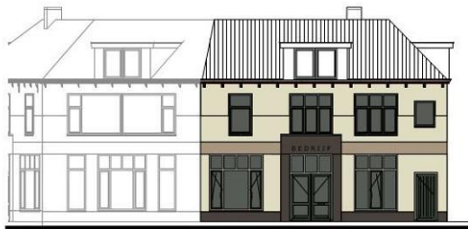
ZUID GEVEL HERMAN KUIJKSTRAAT 54